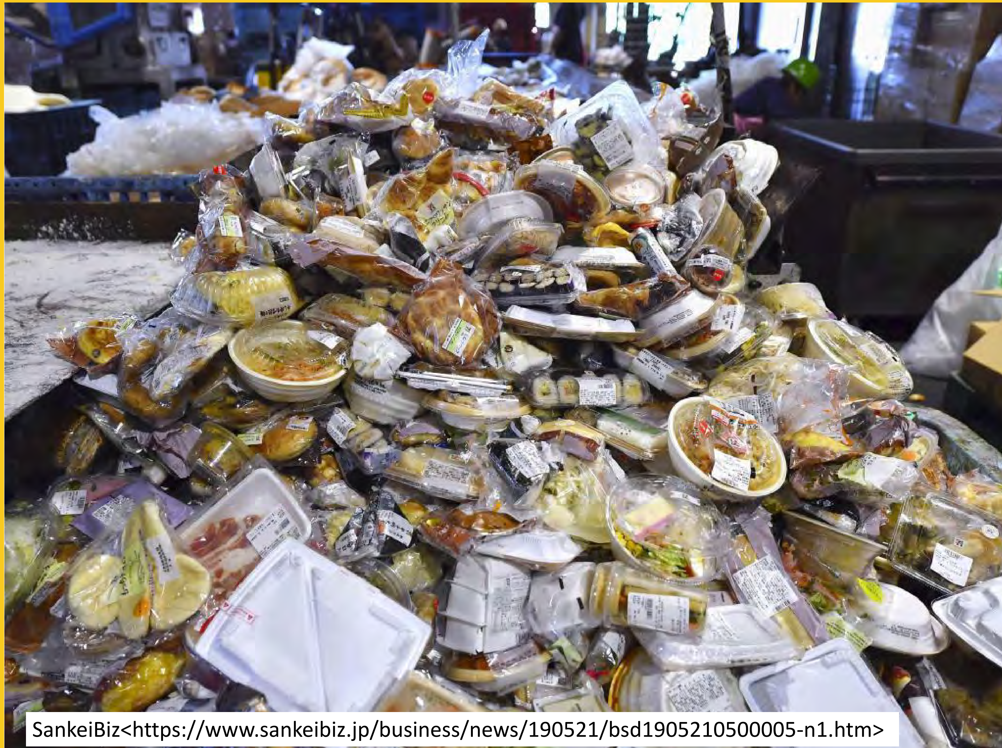
SankeiBiz< https://www.sankeibiz.jp/business/news/190521/bsd1905210500005-n1.htm >