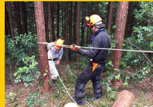
針葉樹の伐倒作業を体験します