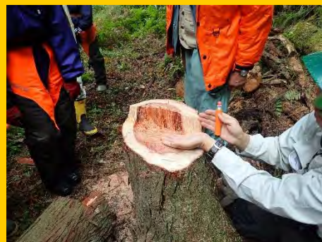
専門家から伐倒技術を学びます