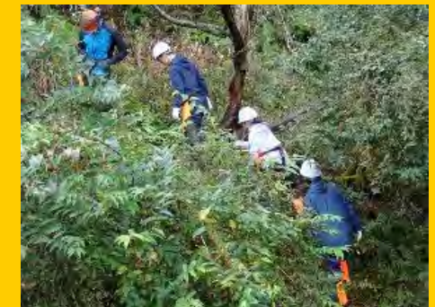
作業歩道作りを体験します