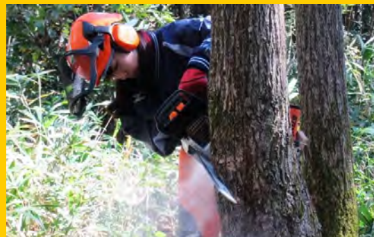
チェーンソーの基本操作を学びます