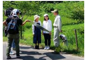
H29 県広報番組収録風景

滋賀県は若いみなさんの視点を必要としています。 青少年広報レンジャーになり、様々な現場を体験・レポートしてみませんか? 活動を通じたみなさんの声が明日のしがを創ります!