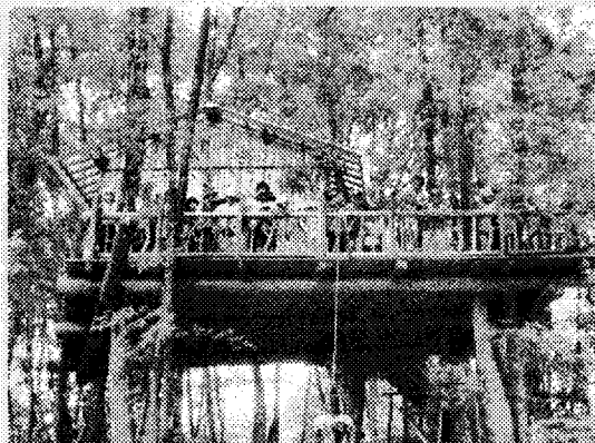
NPO法人 甲賀の環境・里山元気会

第7回(2009年)の助成事業に採択された13団体が、取り組みの進捗状況や課題などを公開で発表しますので、ぜひご参加ください。