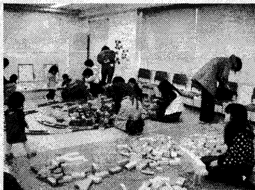
子どもミュージアムをつくる会