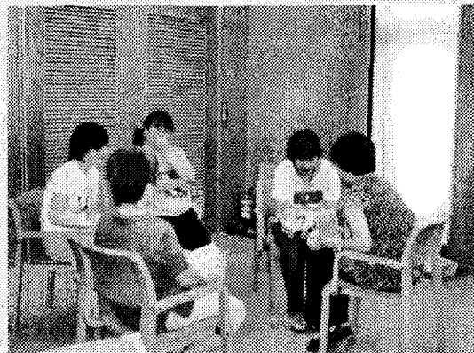
NPO法人 絵本による街づくりの会